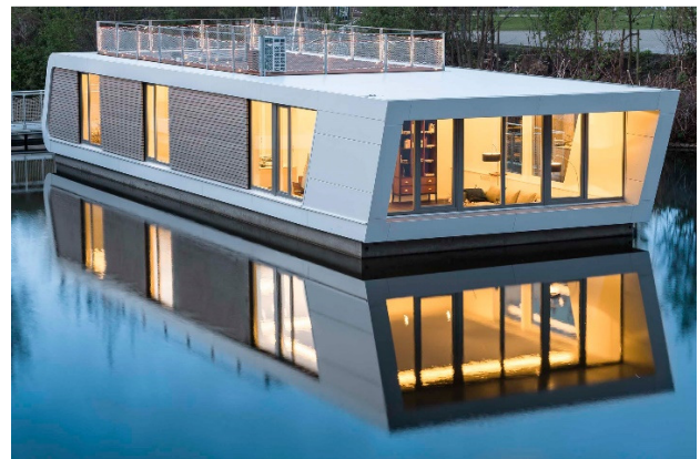
Eksempler på husbåde i Hamburg (illustration: FloatingHomes.de)