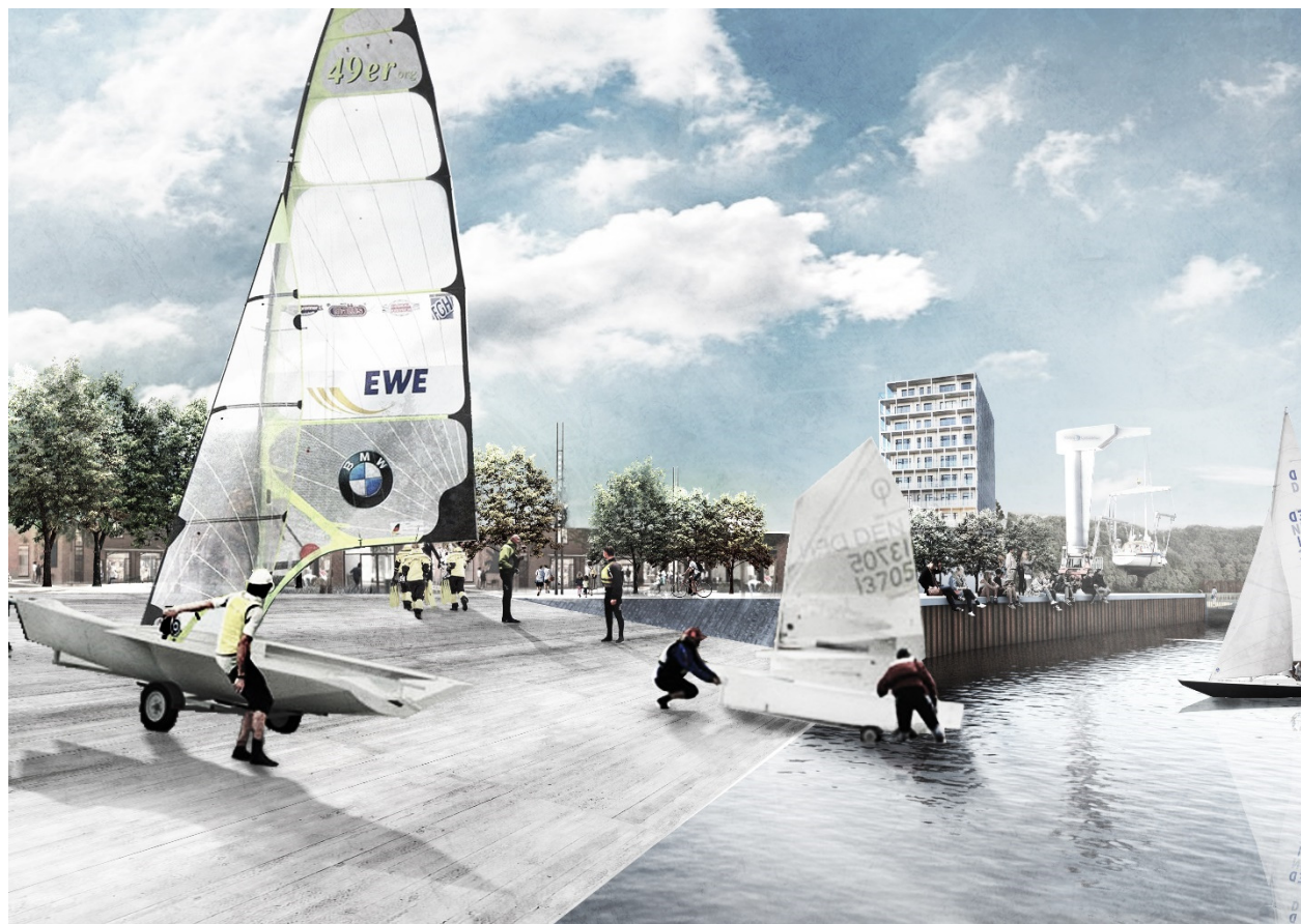
Illustration af den centrale havneplads (Schønher)